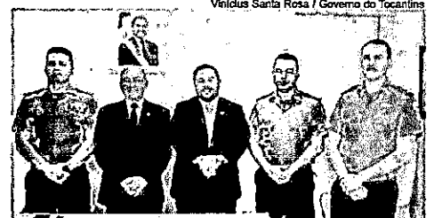
Vinícius Santa Rosa / Governo do Tocantins

"Ajudar na ampliação da sede do Corpo de Bombeiros em Araguaína é também a minha meta enquanto representante do município. Por isso, temos certeza que os recursos assegurados com a destinação desta emenda vão contribuir com a realização desta obra, que será de grande valia e be-