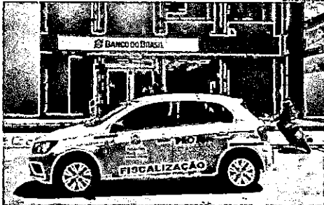
Agência do Banco do Brasil em Tocantinópolis foi uma das atuadas pelo Procon