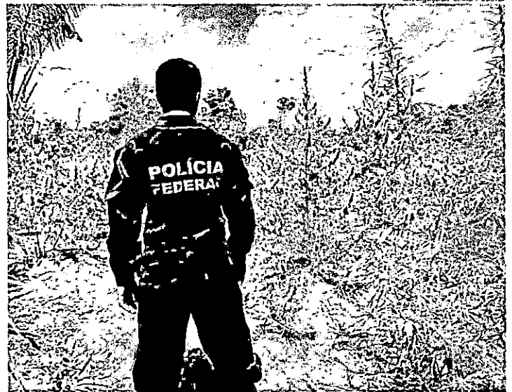
Cannabis é plantada dentro de áreas com florestas no Maranhão

Além disso, só no primeiro semestre deste ano, 9.300 medidas protetivas online já foram concedidas pelo judiciário do Maranhão.